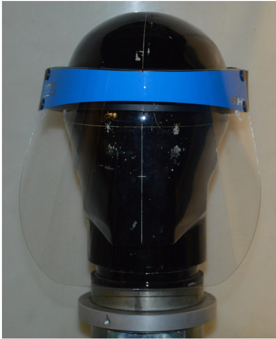
Foto campione e identificazione campione Sample identification and picture